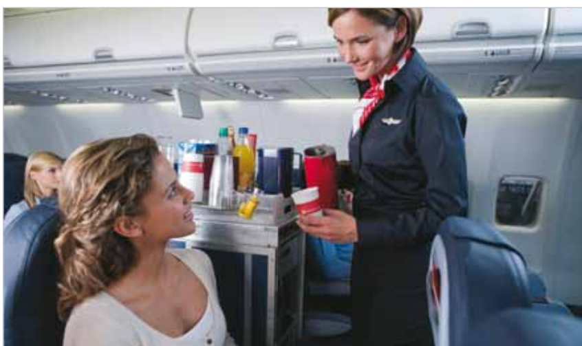
Airlinepromotion mit der Air Berlin

ist eine von zahlreichen Aktionen in Deutschland. Comarch ist ein weltweit tätiger Anbieter von IT-Lösungen mit rund 3.500 Mitarbeitern in 18 Ländern. Unter anderem ist Comarch seit dieser Saison auch Presenter des TSV 1860 München. Falls Sie Fragen zum Thema Airport- & Airlinepromotion haben, senden Sie uns eine E-Mail an: airport@cantus-media.com