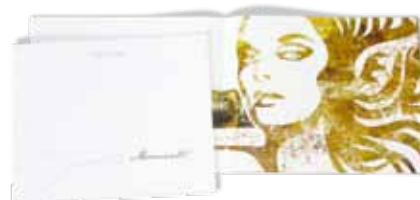
Sofitel F&B Broschüre