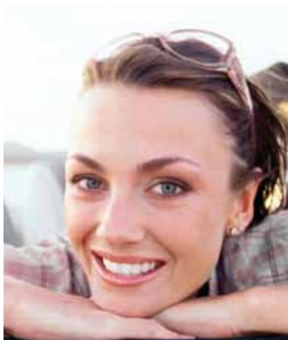
Auto Christian Care Prinzip

Jeder kennt die ärgerlichen Dellen und Beulen, die durch unvorsichtige Verkehrsteilnehmer im Laufe der Zeit an jedem Auto entstehen. Die meisten dieser unschönen Andenken lassen sich mit einer Spezialtechnik von Profis in wenigen Minuten ungeschehen machen. Nach einem kurzen Car Cosmetic Termin bei Auto Christian sieht Ihr Lack aus, wie frisch gebügelt. Ihr Gutschein für die kostenlose Entfernung einer Parkdelle im Gesamtwert von maximal 150 Euro erhalten Sie bei uns unter: gutschein@cantus-media.com