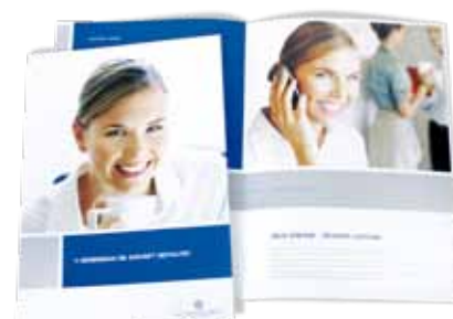
Automaten Seitz Imagebroschüre