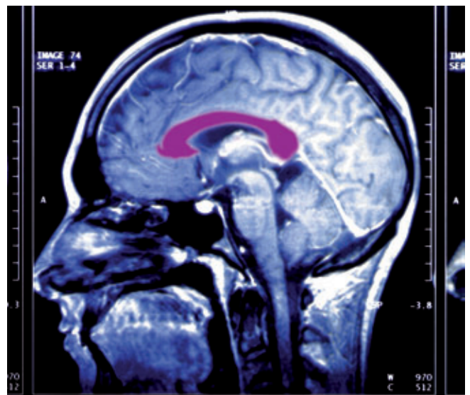
Das Branding Codes System hilft bei der neuropsychologischen Positionierung von Marken. Die Kommunikation kann so „gehirngerecht“ positioniert werden.

erfolgreich neu positioniert sondern auch die neue Rechnungswesensoftware SharkNex auf Basis des BRANDING CODE SYSTEMS® eingeführt. „Mit Branding Code haben wir nun einen guten Rahmen, mit dem